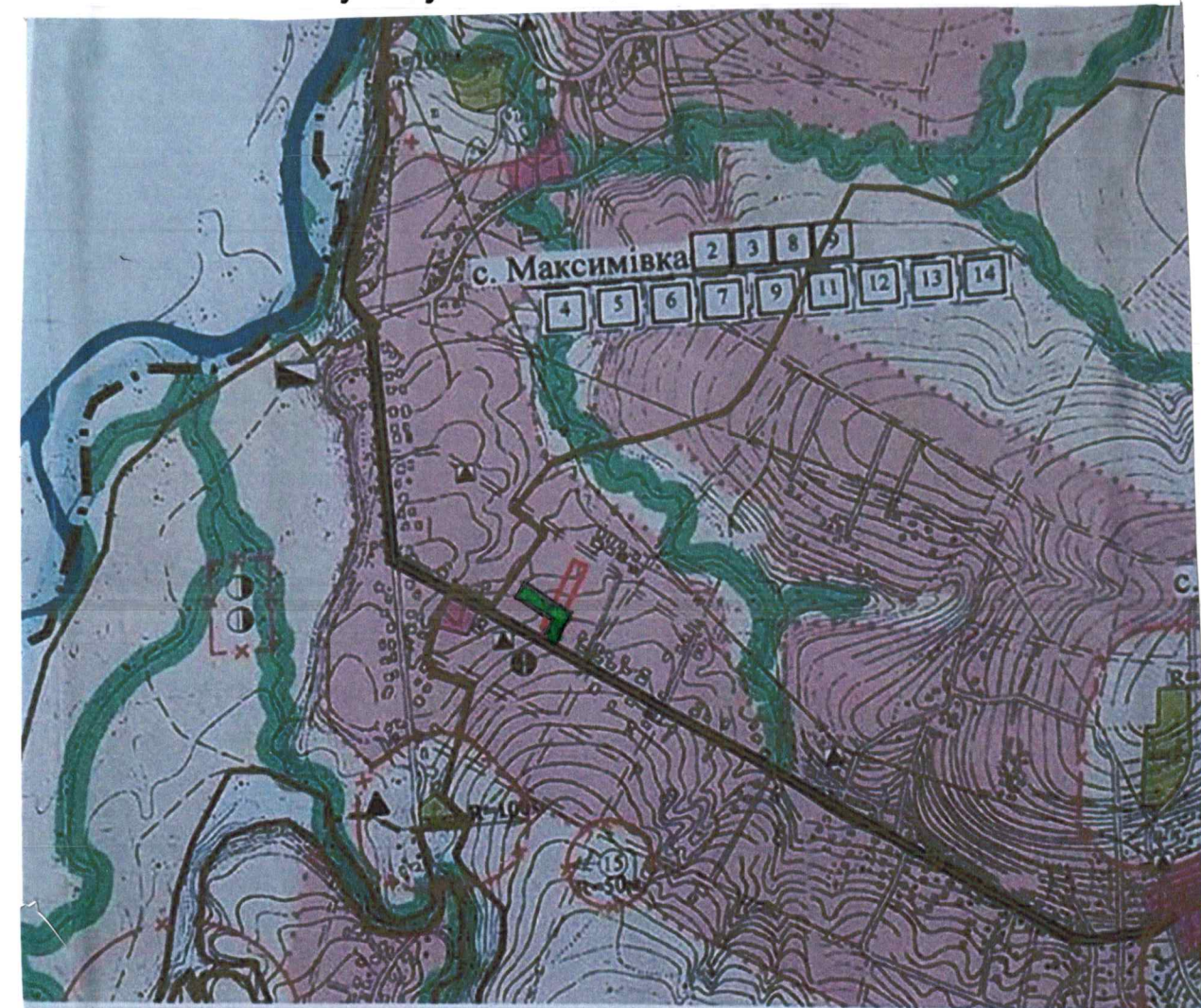
Схема розташування території в планувальній структурі населеного пункту М 1:10 000

Умовні позначення: - територія під будівництво 0.1560га